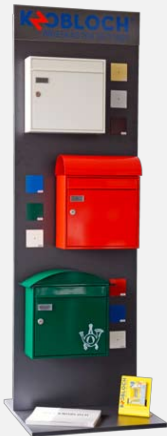
1) Display „Classic“

Die Preise für die Präsentationsdisplays der Design Line finden Sie in der Preisliste des Design Line-Katalogs. Alle Kosten der 1869er-Module erfahren Sie bei Ihrem Knobloch-Kundenbetreuer.