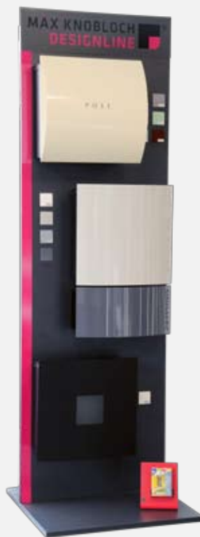
3) Display „Modern“