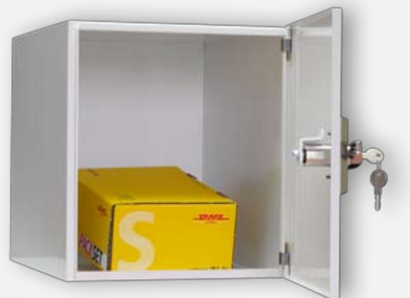
Paketbox HA3744T, geöffnet

Zur Kalkulation fragen Sie am besten Ihren persönlichen Knobloch-Kundenbetreuer. Gerechnet wird einfach der entsprechende Briefkasten plus pauschaler Netto-Aufpreis für die Schlossintegration.