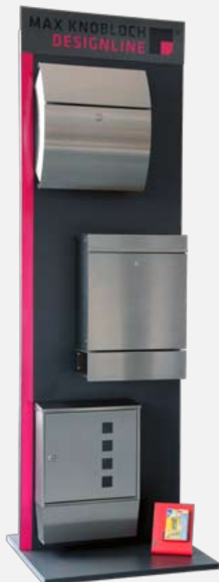
2) Display „Exklusiv“