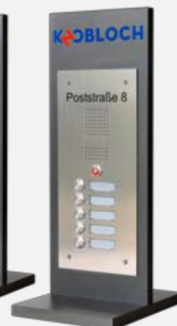
5) Displays „KP2“