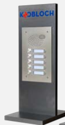
4) Displays „KP1“