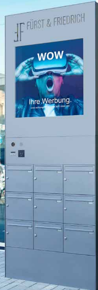
Referenzobjekt in Düsseldorf: Briefkastenanlage mit hinterleuchteter Werbetafel und Durchgravur des Kundenlogos, mit verschiedenen Funktionselementen wie Kamera, Klingeln und digitalem Responder