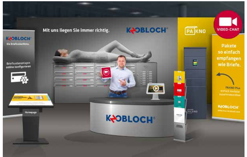
Virtueller Messestand auf der Technic meets Profession 2020 der EFG-Gruppe

Während des Lockdowns arbeiteten viele unserer Kollegen aus dem Homeoffice. Das verlief sehr gut, trotzdem schätzen wir den persönlichen Kontakt mit Ihnen sehr. Corona zum Opfer fielen leider auch unsere beliebten Händler-Schulungen. Wir feilen deshalb gerade an unserer Webinar-Karriere. Zukünftig wollen wir Schulungen auch digital stattfinden lassen. Wobei wir uns sehr darauf freuen Sie wieder direkt zu treffen. Wir wollen unser „analoges“ Schulungsprogramm wieder aufnehmen, sobald es die Situation ohne Bedenken zulässt. In der Zwischenzeit üben wir uns in Webinaren und tummeln uns auf virtuellen Messen. Vielleicht sieht man sich ja?