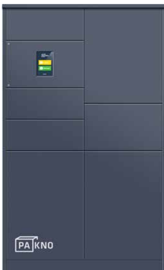
Konfigurationsbeispiel mit Basismodul A erweitert um Zusatzmodul 4.